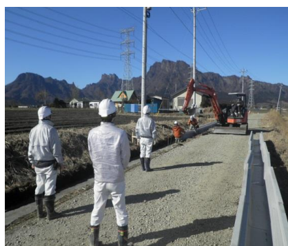
【月1回のパトロール】